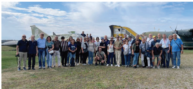
La Sezione UNUCI Padova in visita al Militärluftfahrtmuseum a Zeltweg (A)

Si prega di comunicare tempestivamente alla Segreteria ogni variazione domiciliare e/o indirizzo mail