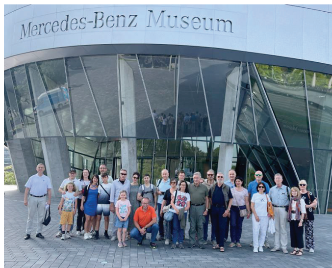
La sezione di Padova in visita al museo Mercedes Benz a Stoccarda (D)